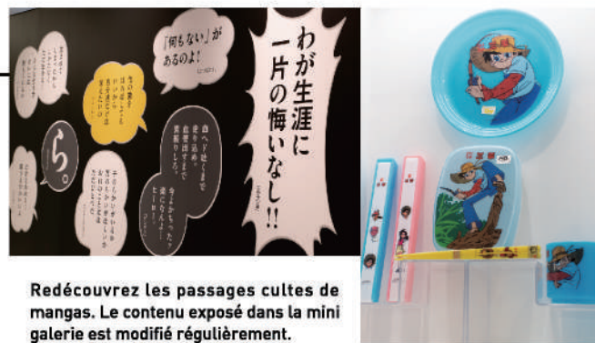
Redécouvrez les passages cultes de mangas. Le contenu exposé dans la mini galerie est modifié régulièrement.

Tout le monde a eu un jour l'impression que les mangas étaient aussi une école de la vie. En parcourant notre route des passages cultes, vous pourrez revivre ces scènes marquantes. Vous pourrez admirer dans la mini galerie une grande variété d'œuvres et d'objets qui vous rappelleront vos artistes et mangas préférés : planches originales, articles promotionnels, objets fétiches de tel ou tel auteur, entre autres.