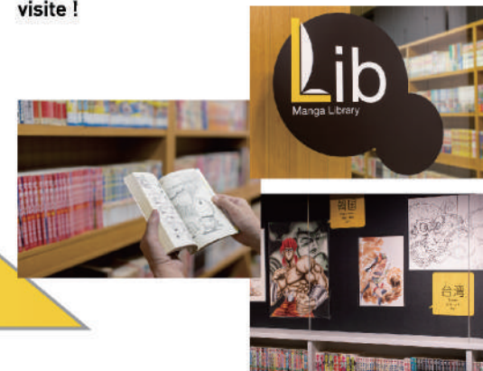
Lisez aussi des mangas réalisés par des auteurs coréens, chinois, taiwanais, hongkongais ou encore malaisiens dans la galerie des auteurs étrangers. Les éditions étrangères de BD japonaises sont également exposées.

Que ce soit des mangas ou des magazines sur les mangas, n'hésitez pas à lire l'un de nos 25 000 livres mis à votre disposition. Des chaises et même un espace pour lire allongé sont prévus à cet effet. Il est aussi possible de les emporter en dehors de cette zone tant que vous restez dans l'enceinte du musée. N'hésitez pas à venir à la recherche d'œuvres qui ont attiré votre attention lors de votre visite !